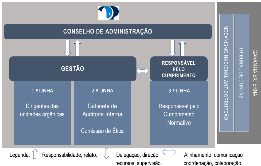
Figura 2 – Modelo das Três Linhas da Docapesca para a gestão dos riscos de corrupção e infrações conexas

As funções e responsabilidades de controlo e reporte no processo de gestão dos riscos de corrupção e infrações conexas encontram-se distribuídas segundo o modelo de três linhas representado na figura 2 5 .