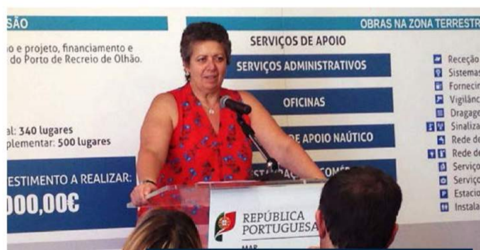
Ministra do Mar, Ana Paula Vitorino

A área adjacente à doca, para Poente, de acesso ao plano de água e rampa varadouro, será afeta à construção de edifícios para serviços de apoio: serviços administrativos e de apoio náutico, oficinas, restauração e comércio.