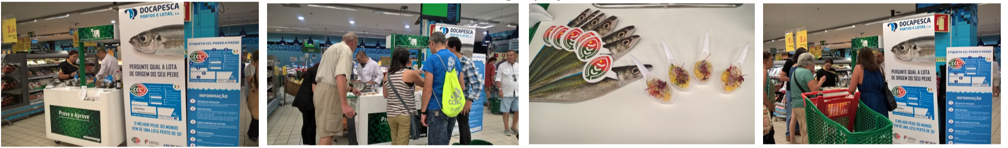
Continente de Matosinhos | 29 julho